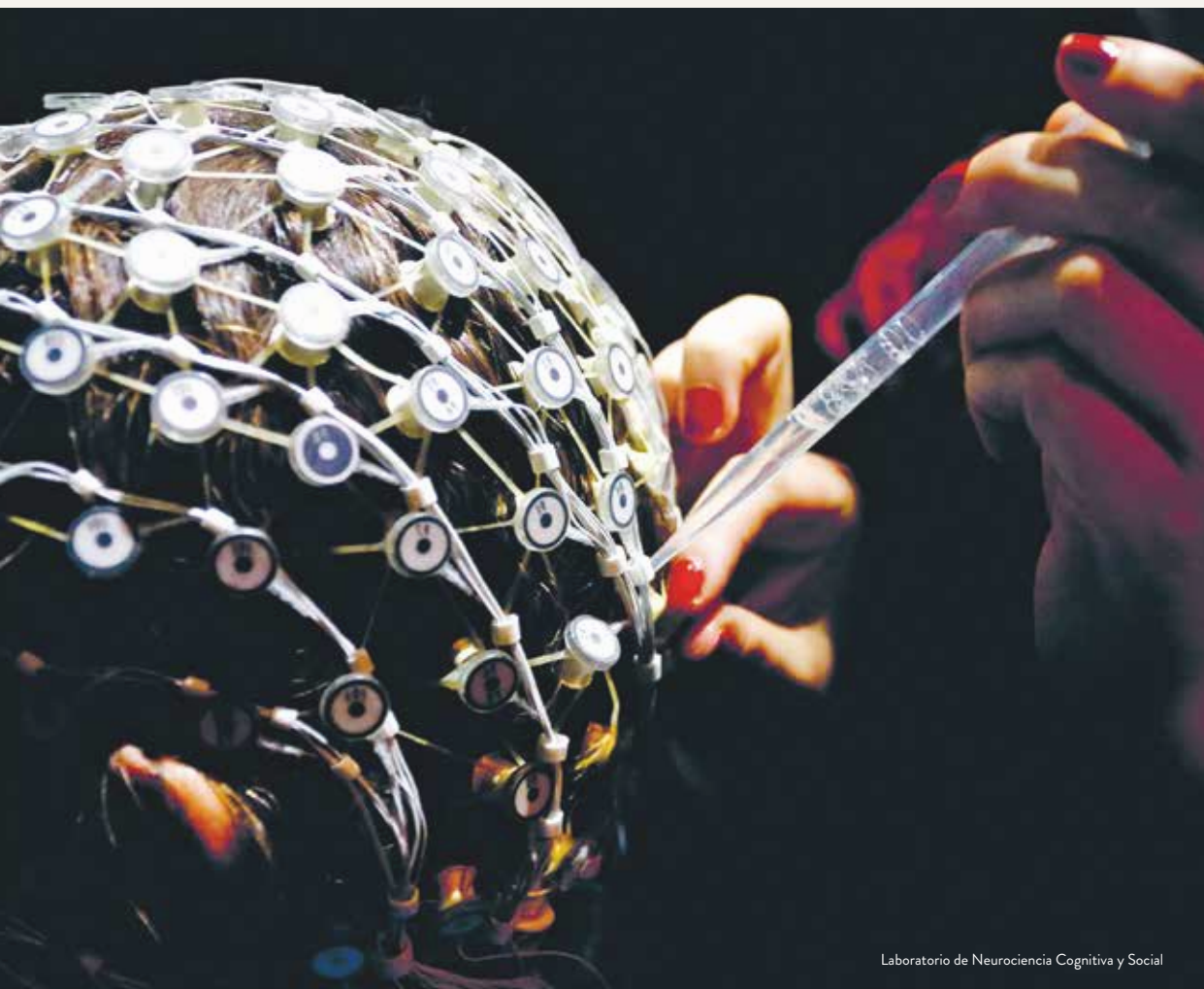
Laboratorio de Neurociencia Cognitiva y Social

focalizándose en el impacto de los mismos a nivel de la salud, las experiencias, el bienestar y las identidades de trabajadores y trabajadoras insertos en distintos contextos laborales.