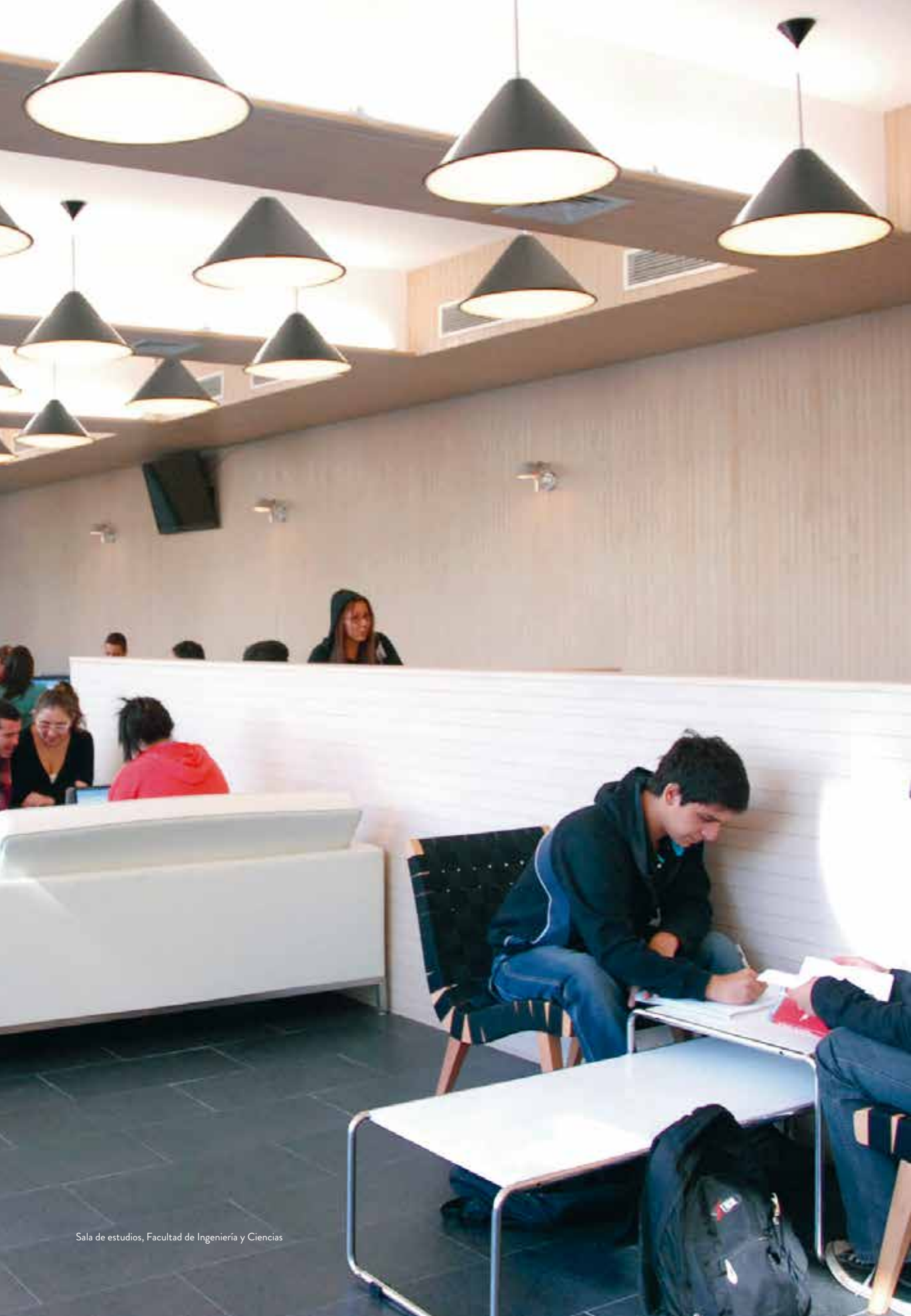
Sala de estudios, Facultad de Ingeniería y Ciencias