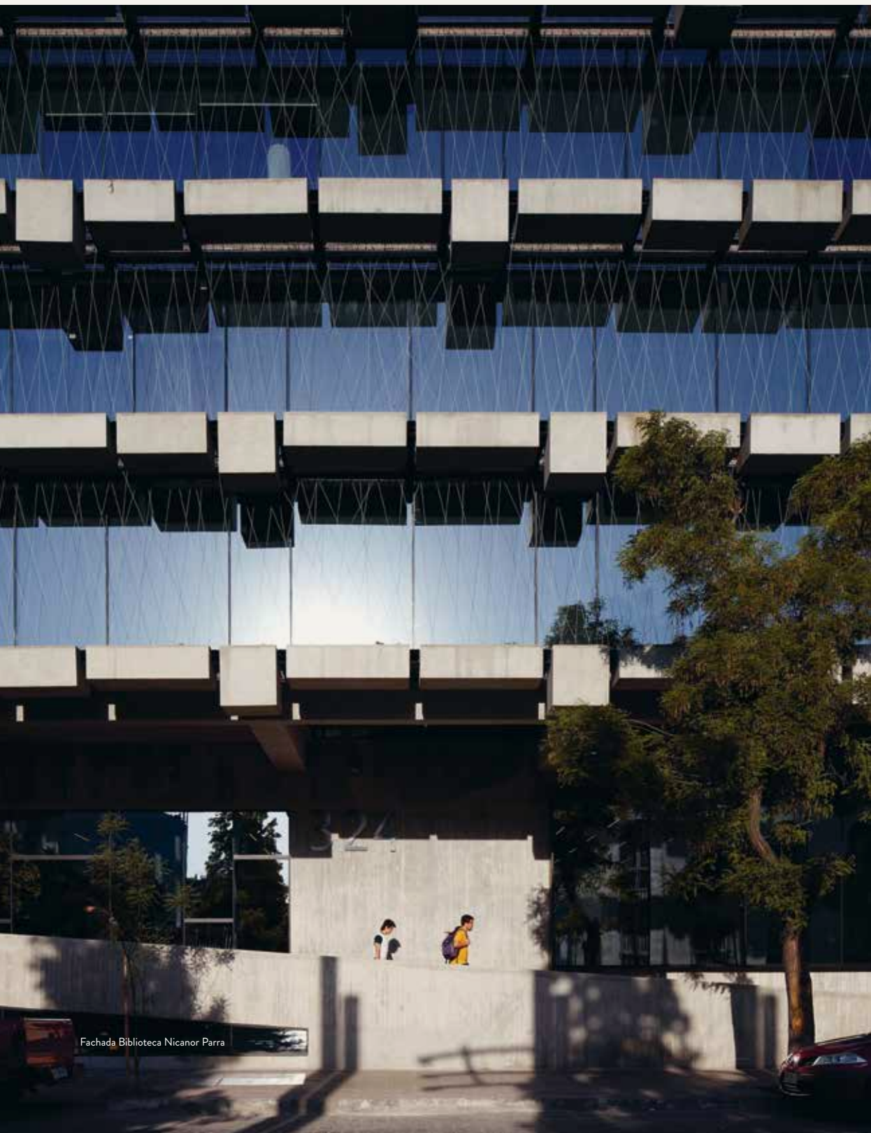
Fachada Biblioteca Nicanor Parra